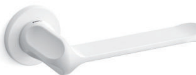
Bianco opaco Mat white