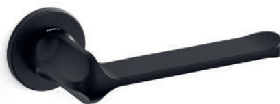
Nero opaco Mat black