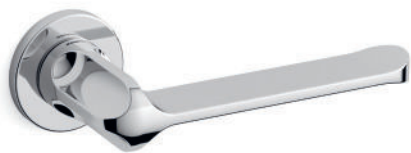
26 Cromo lucido Polished chrome