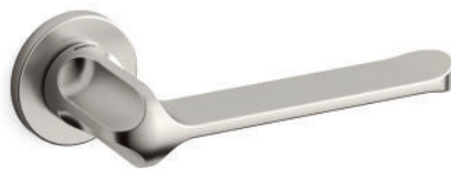
MSN Nickel satinato opaco Mat satin nickel